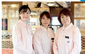
令和7年4月6日より 震災語り部観光列車 運行